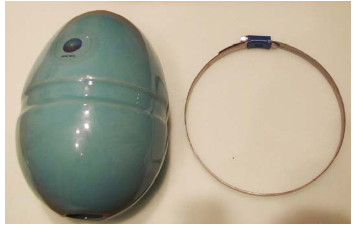
Länge: 20 cm, Durchmesser: 13 cm, ID 33mm (> 7 cm Abstand zur Wand erforderlich)

Lebendiges Wasser, z.B. unbelastetes Quellwasser unterscheidet sich in aller Regel bezüglich der biologischen Wasserqualität deutlich von dem uns zur Verfügung stehendem Leitungswasser: Gewöhnliches Leitungswasser ist rein geschmacklich nicht mit Quellwasser zu vergleichen; das gleiche gilt für die biologische Verträglichkeit (Förderung des Stoffwechsels, Entgiftungsfähigkeit, Erfrischungs- und Belebungs-effekt usw.). Aufgrund der technischen (physikalischen und chemischen) Aufbereitung sowie des Transports durch gerade Leitungen verliert das Wasser seine Spannkraft und Vitalität. Ein Effekt davon ist z.B., daß sich Kalk an Rohren und Geräten, Armaturen und anderen Flächen auskristallisiert, was unter Umständen zu erheblichen Zusatzkosten (Energie und Reinigungsmittel, Wartungskosten etc) führen kann. Zudem ist unser heutiges Leitungswasser in der Regel u.a. mit Elektrosmog belastet, was die physikalische und biologische Qualität stark reduziert.